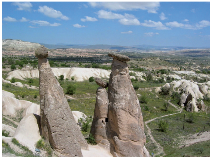
Les trois güzeller à Ürgüp en Cappadoce

Outre-Mer dans les DOM-TOM. Différence dans les manières de penser, d'agir, d'organiser. Différence de culture, d'identité, à commencer par le régime alimentaire. Tout cela se traduit sur place par une période d'adaptation plus ou moins longue (que l'on pourrait s'amuser à mesurer selon le degré d'éloignement culturel ), mais aussi d'efforts pour s'intégrer. Dans mon cas, par exemple, pas question de rester entre expats ou entre français (à vrai dire, je n'ai jamais eu le choix...) La condition sine qua non d'une expatriation réussie est l' intégration . Pour réussir, pas une minute à perdre, il faut apprendre la langue le plus vite possible, participer à la vie locale, faire connaissance rapidement.