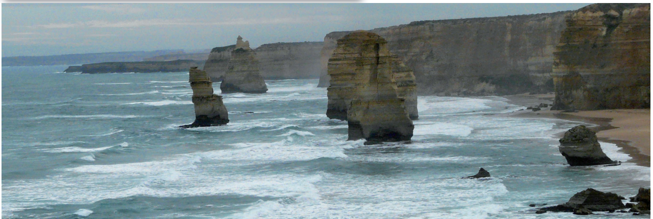
Les rochers des 12 apôtres, Great Ocean Road, Australie