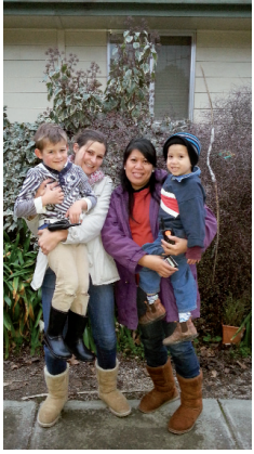
Avec le meilleur ami de mon fils et sa maman, la veille du départ

nous avons ramenés, et partir fut un réel déchirement. Cinq ans et demi plus tard, nos visas en poche, nous volons cette fois vers l'Australie, encore une destination magique. Plus précisément vers Melbourne, pour nous installer à Heathcote dans le Victoria, petite bourgade de 3000 habitants célèbre pour ses Shiraz. Cette fois, nous sommes plus prévoyants*, et comme cela se fait dans la majorité des cas, on nous propose un contrat local. Notre expérience downunder ** fut courte mais intense : nous repartons avec d'innombrables souvenirs en tête, des amis fantastic du bout du monde, et un meilleur niveau d'anglais, ce qui est toujours utile.