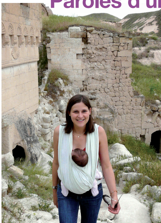
Ancien village de Çavusin, Cappadoce, Turquie

R as le bol de la routine ? Envie de découvrir le monde ? Soit d'aventure ou de nouveaux horizons professionnels ? Volonté de s'impliquer dans des missions humanitaires, la coopération ? Projet de tour du monde en solo ou à plusieurs ? Ou encore une opportunité « que l'on ne peut refuser » à l'étranger ?